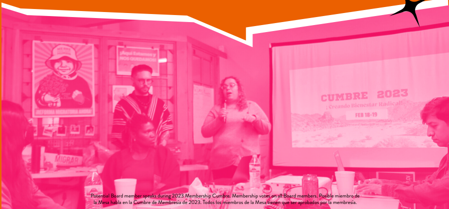
Potential Board member speaks during 2023 Membership Cumbre. Membership votes on all Board members. Posible miembro de la Mesa habla en la Cumbre de Membresía de 2023. Todos los miembros de la Mesa tienen que ser aprobados por la membresía.

Presentamos a los posibles nuevos miembros de la junta en la Cumbre de febrero. Los miembros votaron a favor. Estos nuevos miembros de la mesa se incorporaron entre abril y junio de 2023.